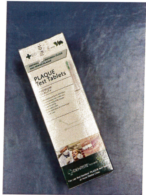
เม็ดยาสีฟัน