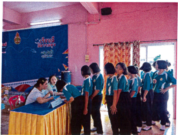
ภาพแสดงการลงทะเบียนผู้เข้าร่วมการอบรม