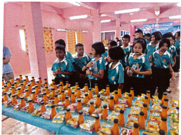
ภาพอาหารกลางวันและ อาหารว่าง 2 มื้อ