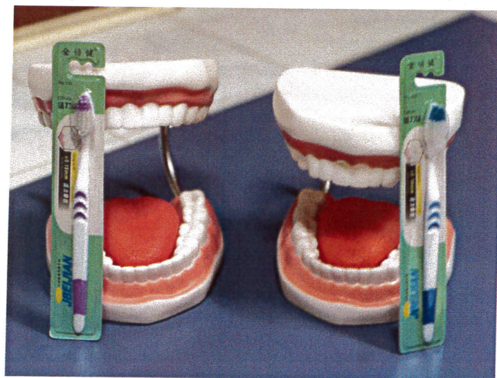
โมเดลสอนแปรงฟัน พร้อมแปรง