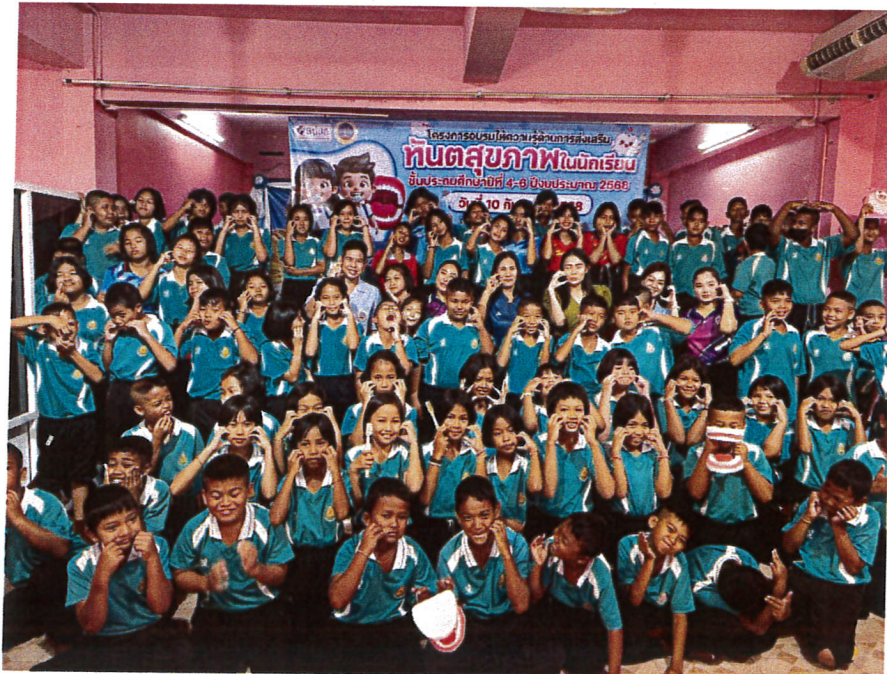
ภาพแสดงพิธีปิดโครงการ