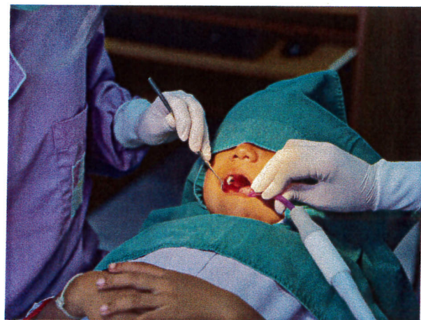
ภาพแสดงการให้บริการทันตกรรมในนักเรียนชั้นประถมศึกษาปีที่ 4-6