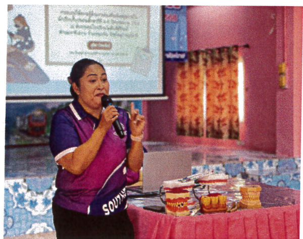
ภาพแสดงพิธีเปิดโครงการ และการถ่ายทอดความรู้โดยวิทยากร