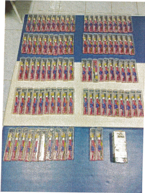
ชุดเซตแปรงสีฟัน + ยาสีฟัน

ภาพถ่ายหรือวีดิทัศน์ภาพการดำเนินการจริง (วันที่ 10 กันยายน 2568)