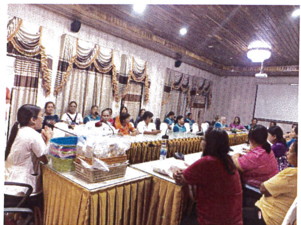
ภาพแสดงการสอบถามแลกเปลี่ยนความรู้หลังอบรม