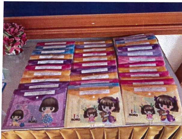
ภาพแสดงการลงทะเบียนผู้เข้าร่วมการอบรม