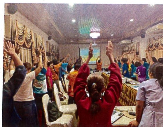
ภาพแสดงพิธีเปิดโครงการ และการถ่ายทอดความรู้โดยวิทยากร