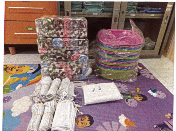
ภาพแสดงอุปกรณ์