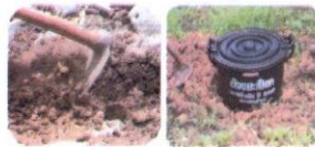
ภาพตัวอย่างจากต้นแบบการจัดการขยะ ชุมชนบ้านป่าบุก อำเภอป่าซาง จังหวัดลำพูน

2 เจาะรูหรือตัดภาชนะดังกล่าวที่ก้นถังแล้วขุดหลุมขนาดความลึก 2 ใน 3 ส่วนของความสูงของภาชนะนำภาชนะที่เตรียมไว้ไปใส่ในหลุมที่ขุด ทั้งนี้หากมีปริมาณขยะอินทรีย์เกิดขึ้นมากและมีพื้นที่เหลือสามารถทำได้มากกว่า 1 จุด